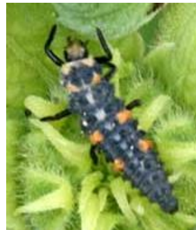
Larve de coccinelle