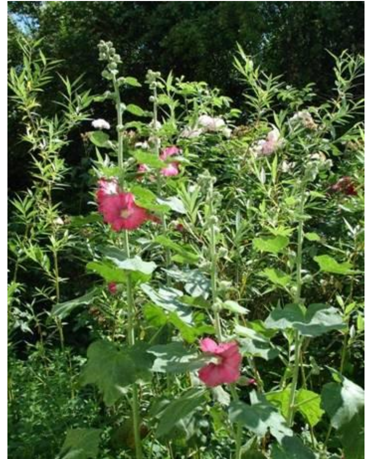
Les roses trémières