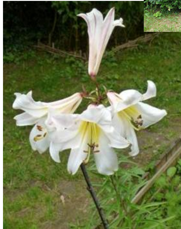
Le lys blanc