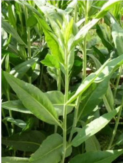
La grande passeraie