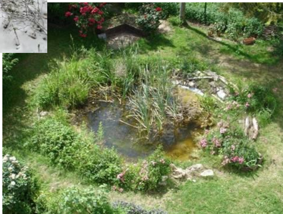
La mare au printemps