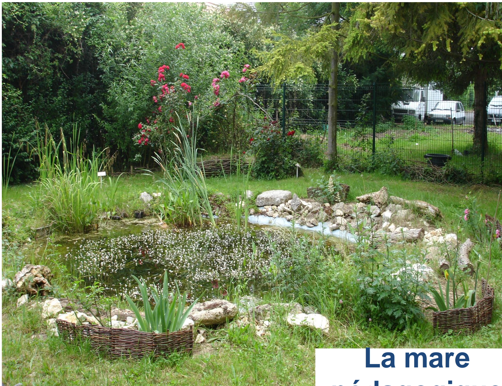
La mare pédagogique