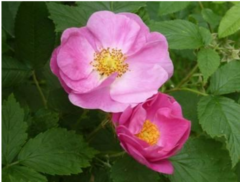
Le rosier de Provins

Pour fleurir les églises et non pas les cellules des moines et des moniales.