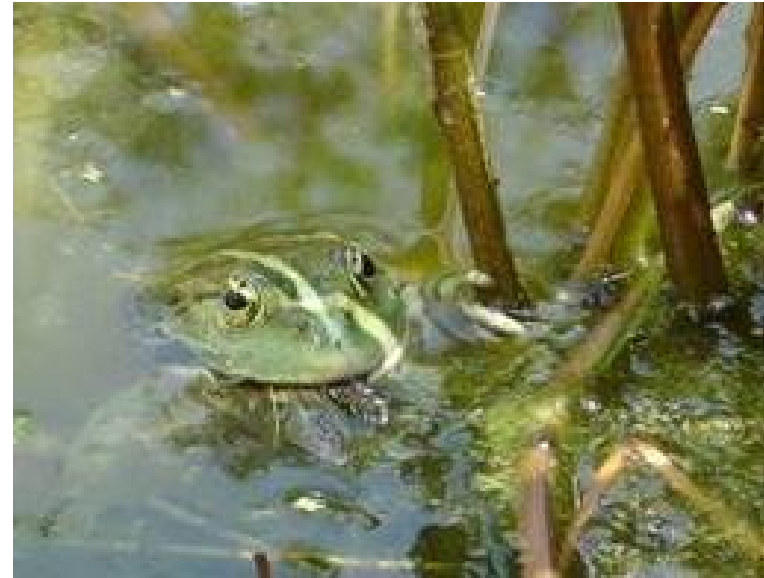
Se délectant d'une libellule