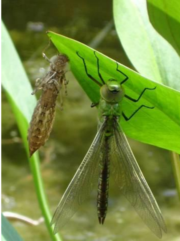
Aeschne bleue et son exuvie