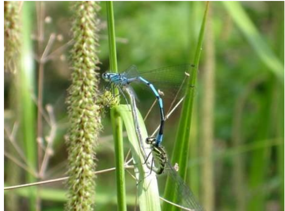
Agrions jouvencelle accouplés