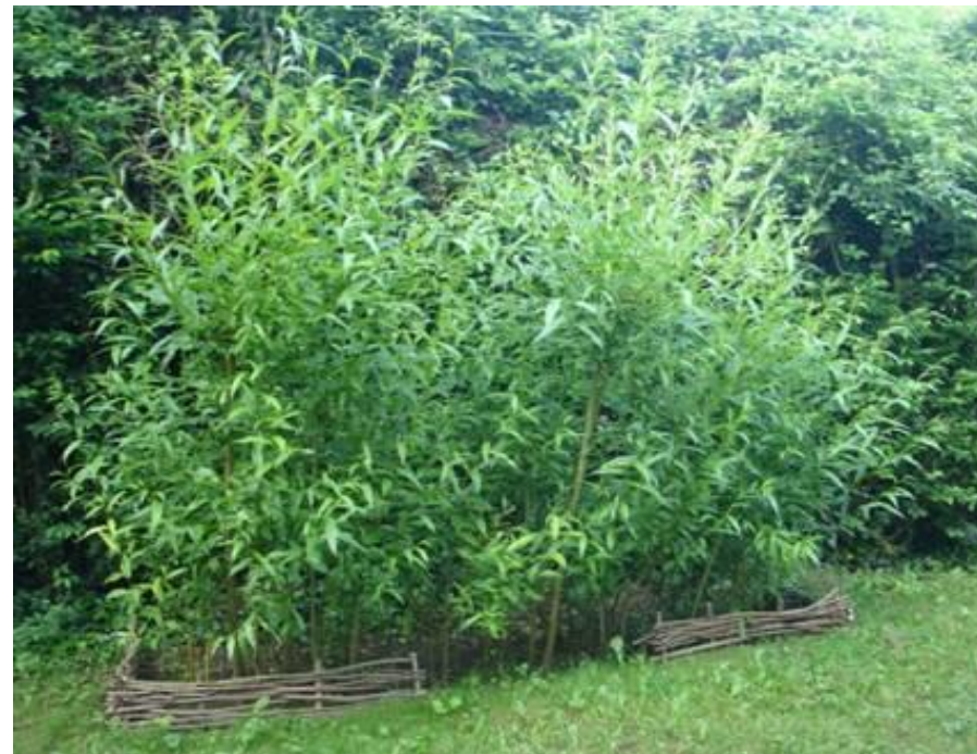
Des saules blancs taillés en « têtard »