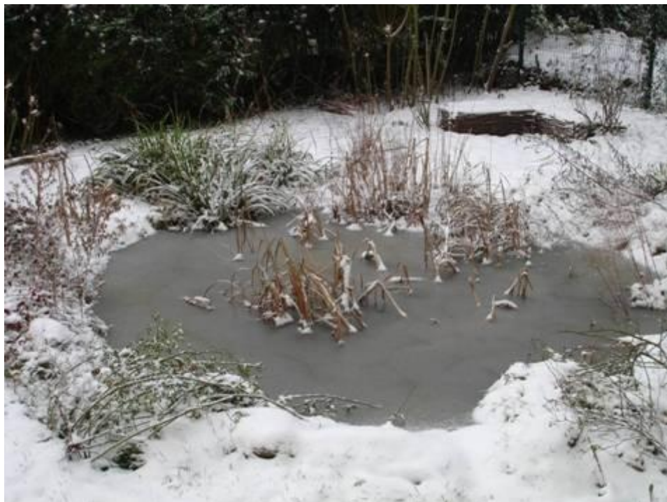
La mare en hiver