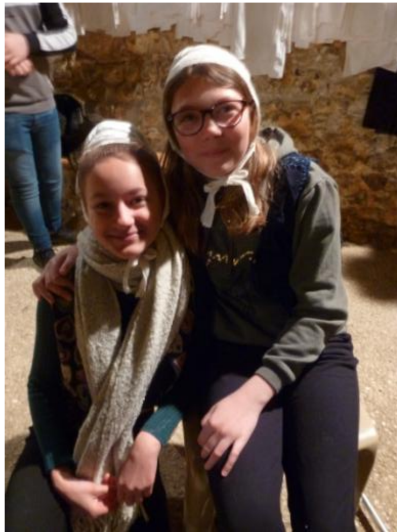
Les gens du peuple