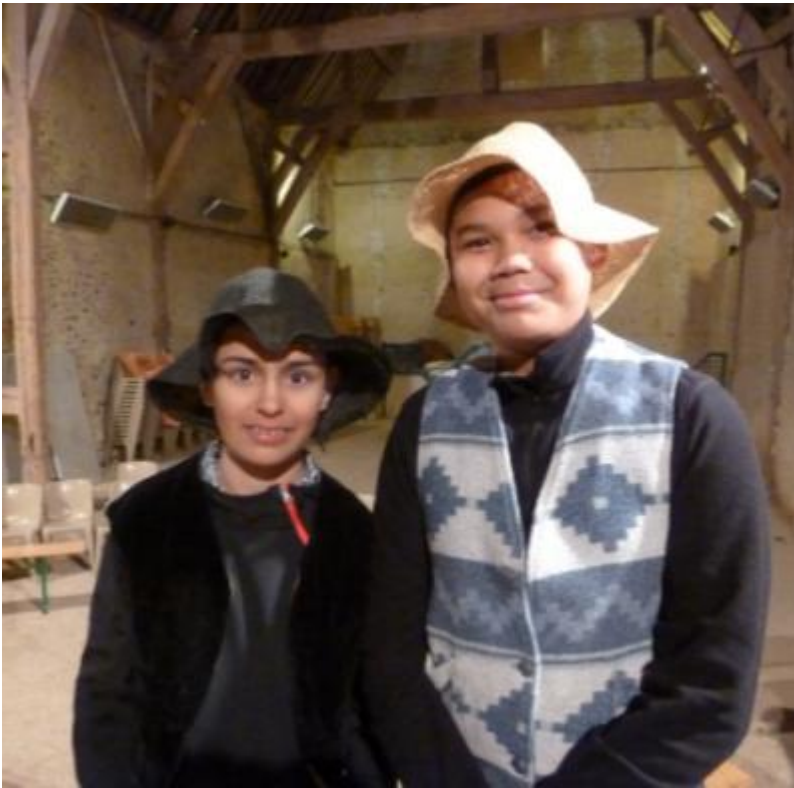
Les gens du peuple