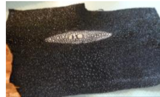
Cuir de raie