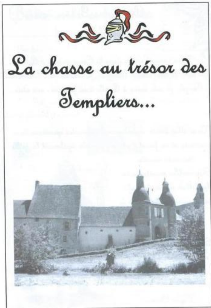
Commanderie d'Arville Départ : porche

Par groupes, nous devons compléter les questions d'un livret pour découvrir l'endroit où est caché le trésor.