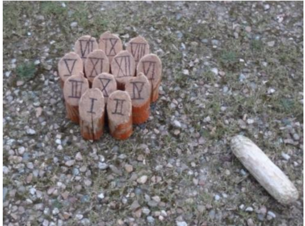
Jeu de quilles