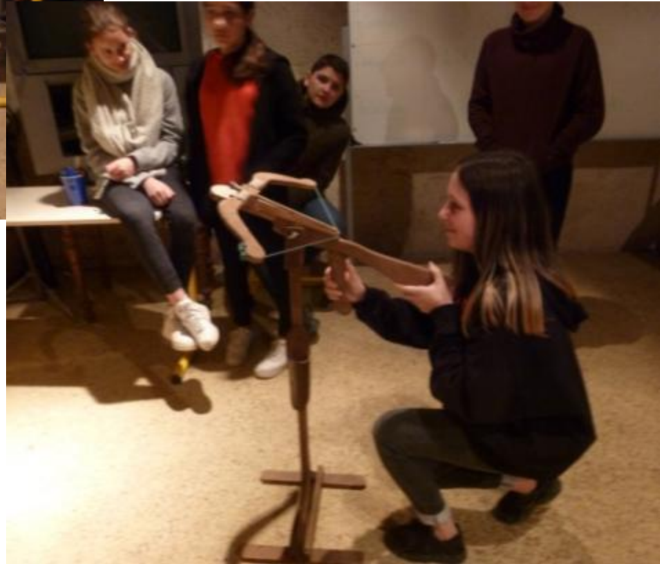
Tir à l'arbalette