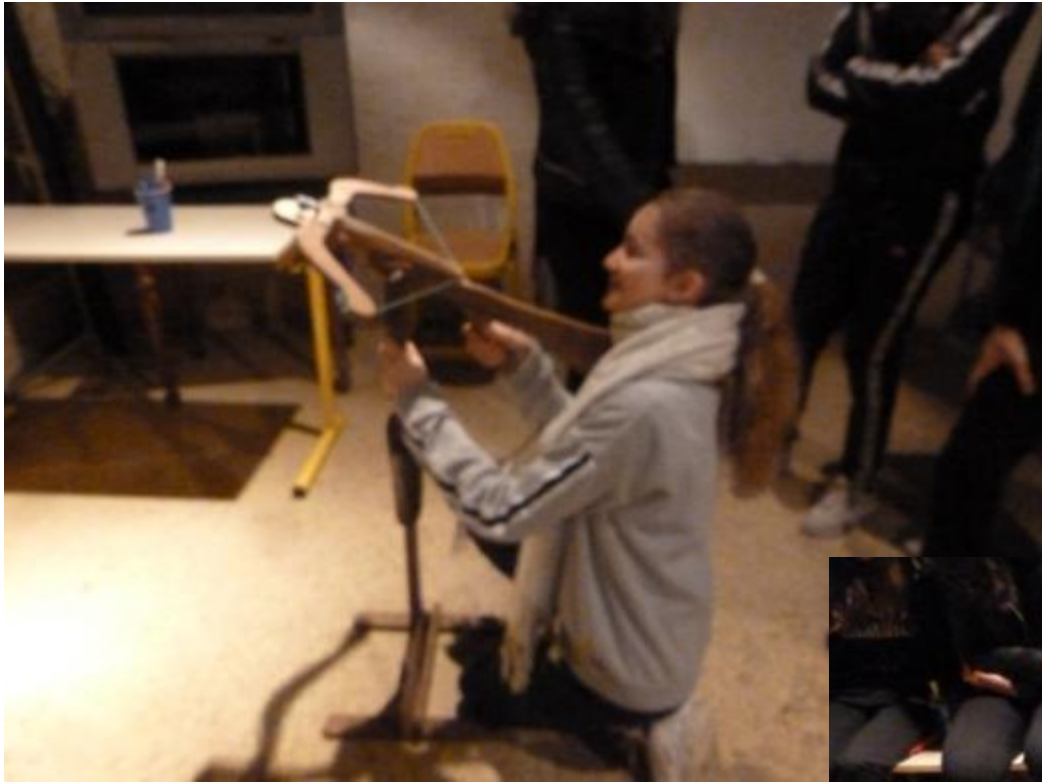
Tir à l'arbalette