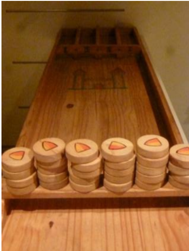
Jeu du palet